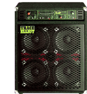
Amplificatore basso uscita diretta DI